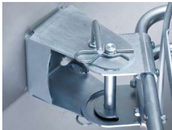
Wandhalterung: inkl. Wandmontageset